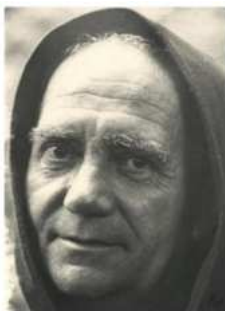
Paul Louis Denis Bellot, architect van de art deco in l'Abbaye Saint-Paul. Paul Bellot (Parijs 1876-Montreal 1944) was een Franse benedictijnermonnik-architect. Hij is van belang om zijn expressionistische art-decobouwstijl. Hij bouwde vooral abdijen en kerken in Frankrijk, België, Nederland, Engeland en Canada.