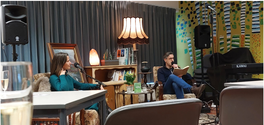
Sfeerbeeld Toast Literair januari 2023